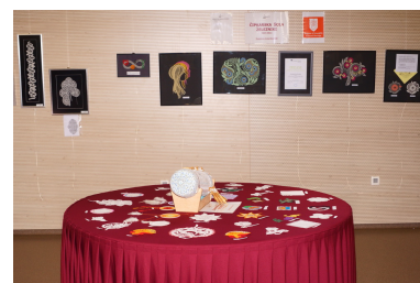
Razstava , Železniki 2024